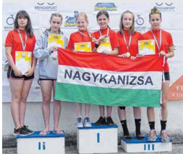
A kanizsai diákok kipróbálhatták a pályakerékpározást a diákolimpia döntőjében