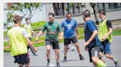
A mai és az örökdiákok nem vére menő csatát vívtak