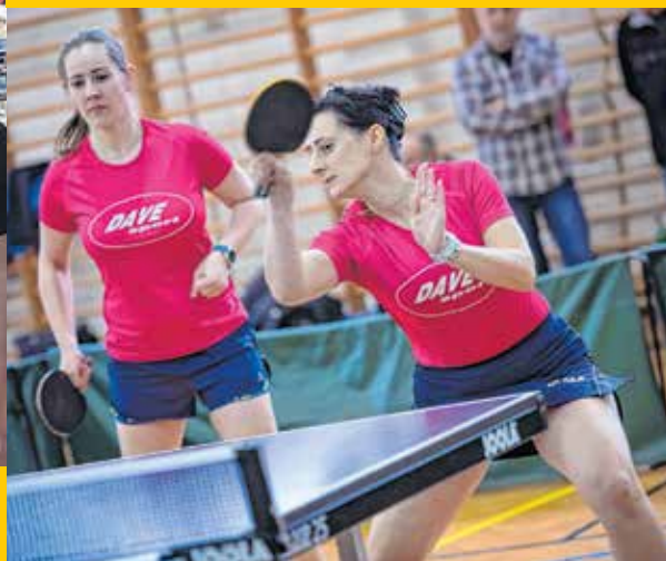
A kanizsai női NB I-es asztaliteniszesezők a Nyugati csoportban végül a harmadik helyen zártak