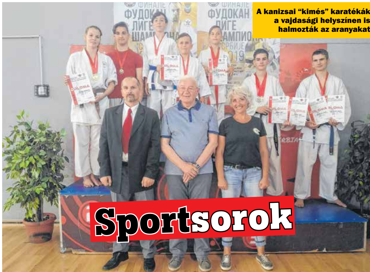
A kanizsai "kimés" karatékák a vajdasági helyszínen is halmozták az aranyakat