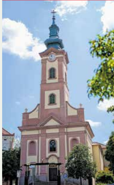
A búcsú a templom névnapja