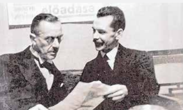
„de mi férfiak férfiak maradunk, és nők a nők – szabadok, kedvesek” – József Attilát is letiltaná Zuckerberg?

Szegény Facebook harcol a valósággal! Jól ki lett találva, mert ez csak így „üzemelhet” termékenyen az élővilágban! Műszaki nyelven szólva, a csavart nem lehet a csavarba illeszteni, az anyát sem az anyába. Csak a csavart az anyába, hogy meglegyen a helyes, ésszerű összeköttetés. Ilyen egyszerű! Nem szervezünk egy heteroszexuális irányultságú Pride-ot? Aki ez ellen lép fel, az heterofób, nem? De ez az egész LGBTQ-társaság családofób, emberofób, gyerekofób, logikafób, természetofób. Miért vagyok „homofób”? Mert nem tartom többre a devianciát a normalitásnál?