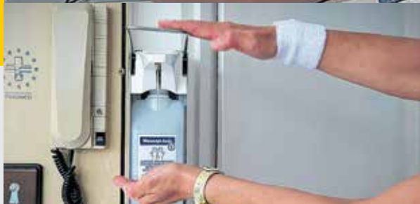
A kézfertőtlenítő készülékeket a betegek és a látogatók is igénybe vehetik