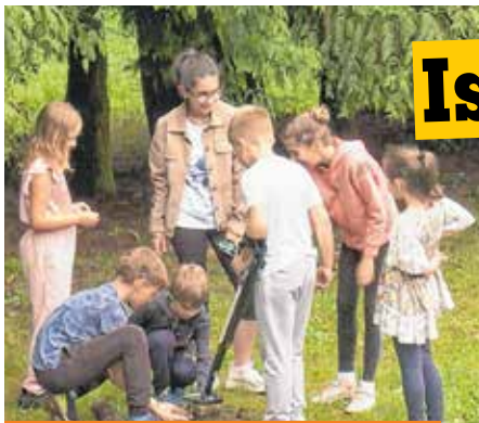
A gyerekeket a játékban még a szemerkélő eső sem zavarta