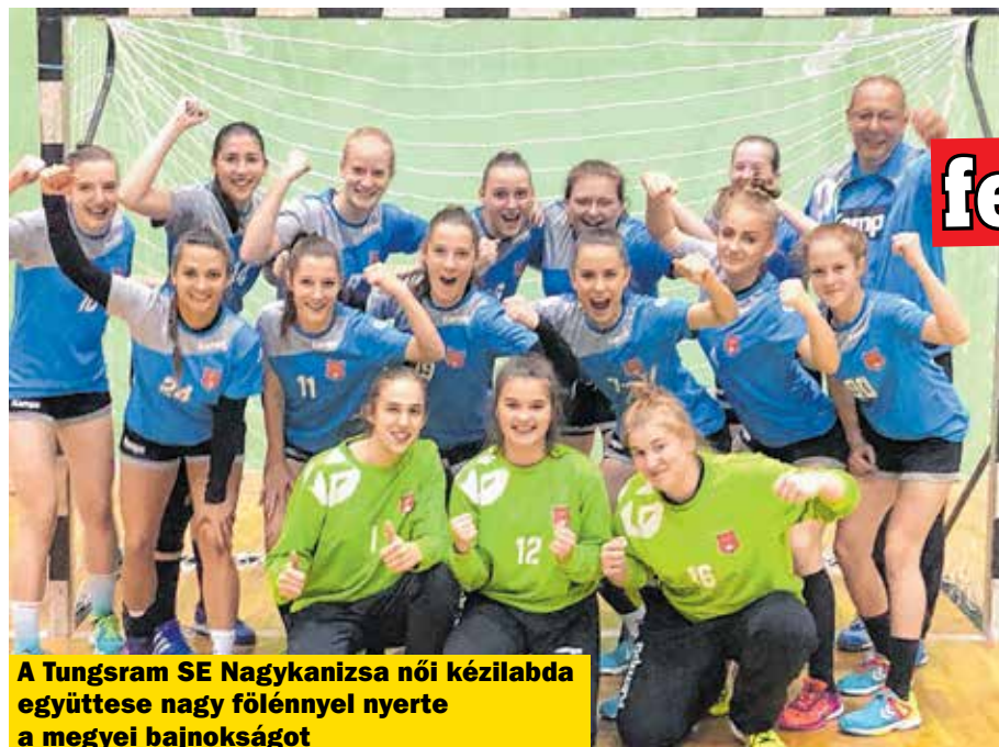
A Tungstram SE Nagykanizsa női kézilabda együttese nagy fölényrel nyerte a megyei bajnokságot

A Tungstram SE Nagykanizsa női kézilabda együttese a nemrég zárult szezonban a felnőtt megyei