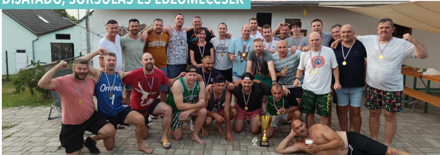
A Sand SE-nél kiadósan megünnepelehetők az aranyérem átvételét

Az utóbbi hetek az NB-s futball mellett (vár)megyés labdarúgás terén is kellő átkötést kínált a németországi labdarúgó Európa-bajnokság árnyékában.