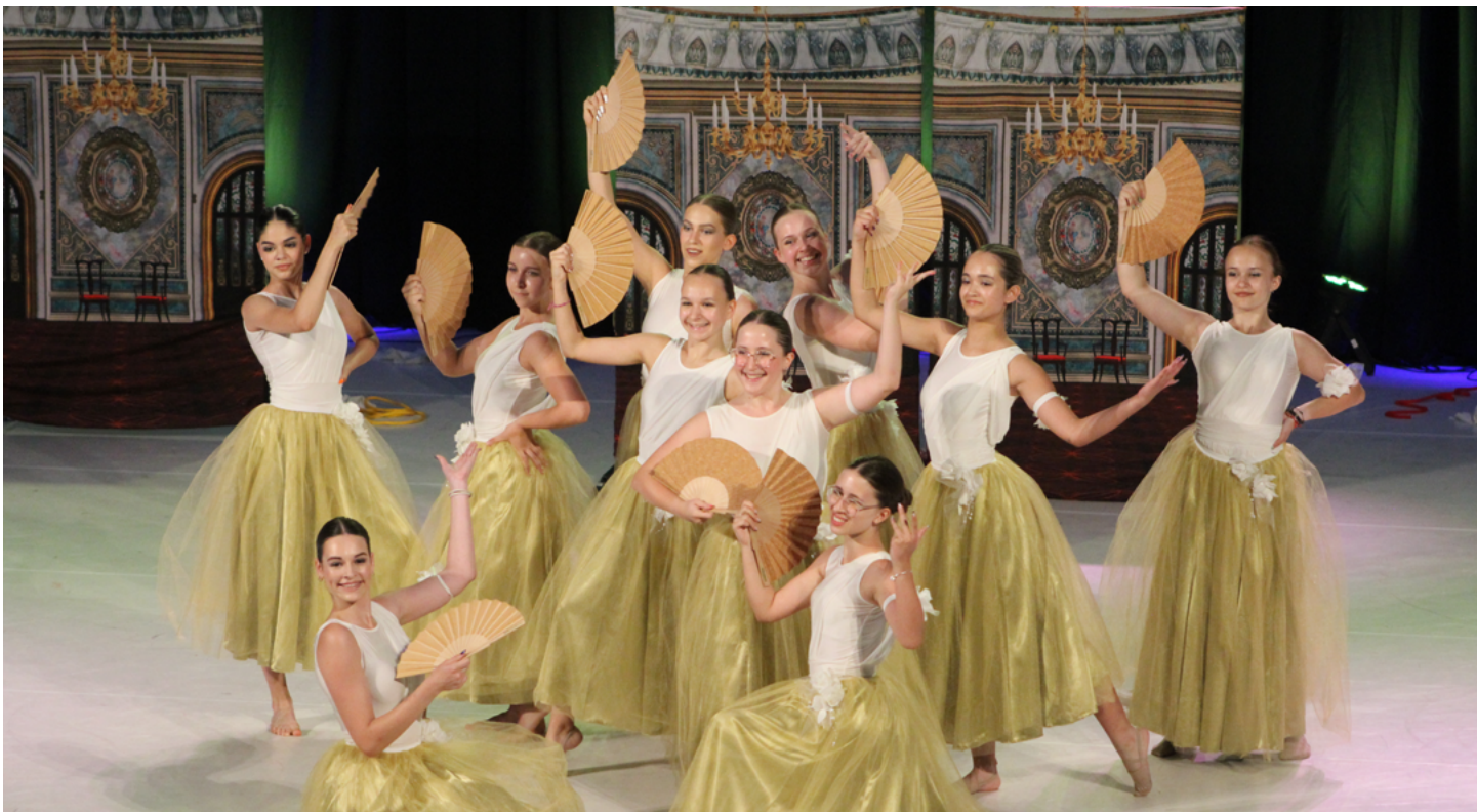
A sors fonala produkció is első helyen végzett a SZKES csoportjai közül

Lényegében a hagyományoknak megfelelően remek eredményekkel zárta a mögöttünk hagyott versenyszezont a Honvéd Kaszinó SZKES Táncsoportja, legutóbb szép eredményekkel tértek haza a Magyar Látványtánc