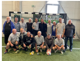
A Nagykanizsa országos bajnok öregfiúk labdarúgó együttese

Az 5. helyért: Örkény – PMFC 1-0. Elődöntők: Kecskemét – Videoton 0-2, Nagykanizsa – Kaposvár 2-0.