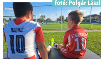
A szepetneki mérkőzés szünetében ha 10-esek találkoznak...