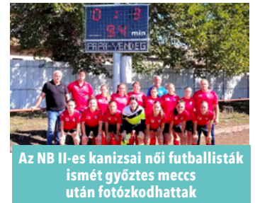
Az NB II-es kanizsai női futballisták ismét győztes meccs után fotózkozhattak

Akár remek felvezetése lehet a szombati találkozón a vasárnap esti férfi NB III-as – szintén a Bányász-sporttelepen sorra kerülő